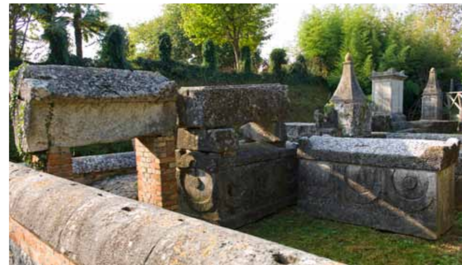
Akvileja, rimska nekropola

mišta također je otvoren za javnost s novim izložbenim postavkama poput one na Via Annia (glavna cesta koja vodi iz Veneta) otvorene 2011. godine. Unutrašnjost muzeja temeljito je preuređena 1955. godine, a izložbene se zone neprekidno osavremenjuju i obnavljaju kako bi pružile nov način istraživanja starina.