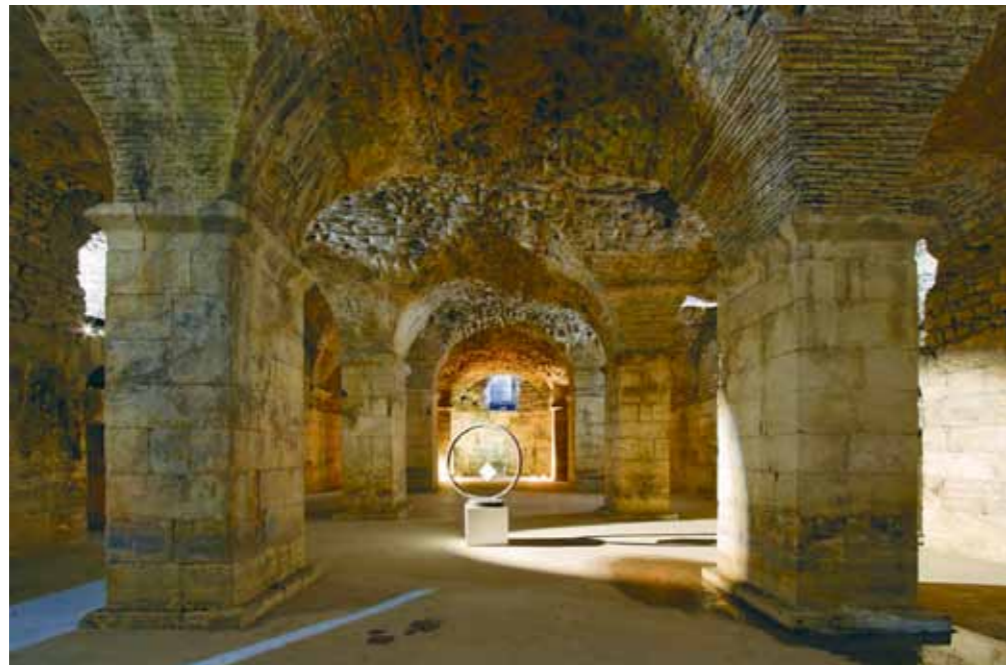
Split, Dioklecijanova palača, podrumi

je koristeći tradicionalne materijale i tehnike. Konstruktivno stanje baroknog kora dodanog staroj građevini u 17. vijeku propadalo je zbog loših temelja i slabog kvaliteta zidarskih radova. Konstruktivna sanacija započela je injektiranjem temelja i postavljanjem čelične zategnute užadi . Unutrašnjost kora također je potpuno obnovljena, a posebna je pažnja posvećena dotad vrlo zapuštenim baroknim arhitektonskim elementima. Započeto je lasersko čišćenje pročelja, koje se nastavlja na unutrašnjoj strani zidova i kupole građene ciglom, a nova rasvjeta omogućava doživljaj složenosti katedrale. Čitav niz restauratorskih radova odvija se unutar same katedrale.