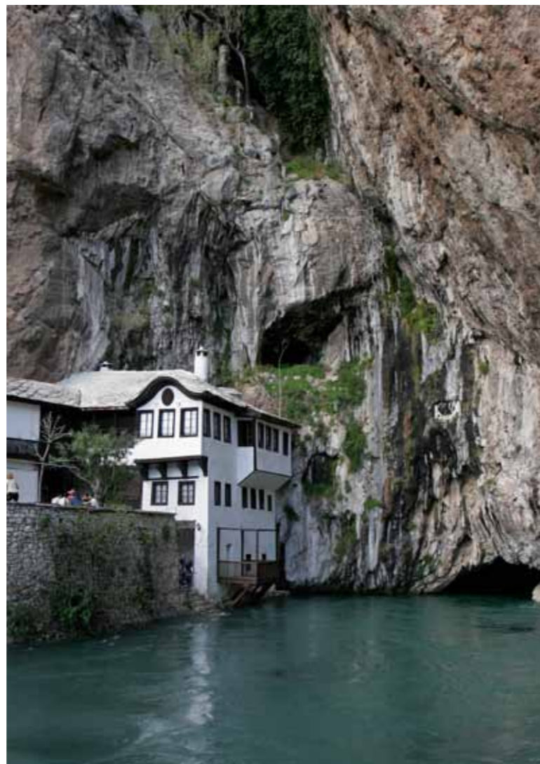
Blagaj, tekija na rijeci Buni

Zbog njene naglašene otvorenosti i preglednosti, zbog nsvakadašnje mogućnosti i kulturne privilegije da se jednim pogledom obuhvate ni manje ni više nego četiri carstva (rimsko, vizantijsko, osmansko i austrougarsko) , tri kraljevstva (bosansko, ugarsko i jugoslovensko), tri svjetske monoteističke religije - kršćanstvo (pravoslavlje i katolicizam), islam i judaizam – najraznovrsniji graditeljski stilovi i običaji koji se u kulturnim krugovima definiraju kao mediteranski, centralnoevropski, zapadnoevropski, vizantijski, balkanski i osmanski, historijska jezgra Stoca