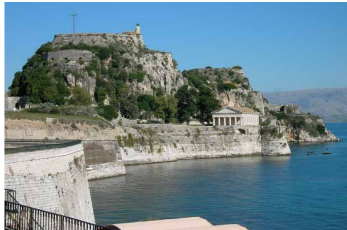
Krf, Stara palača

gradskih zdanja), te reorganizaciji obrazovnog sistema (1824. otvorena je nova Jonska akademija) doprinijevši time uzavrelim intelektualnim previranjima koja su zaiskrila za vrijeme francuske okupacije. Istovremeno su Britanci započeli s rušenjem vanjskih fortifikacija na zapadnom dijelu grada i planiranjem stambenih kvartova izvan odbrambenih zidina. Ostrvo je 1864. godine priključeno Kraljevini Grčkoj. Tvrđave su razoružane, a više je dijelova perimetralnih zidova i fortifikacija postepeno uklonjeno. Ostrvo je postalo omiljeno odmaralište evropske aristokratije. Stari grad teško je oštećen u bombardiranju 1943. godine.