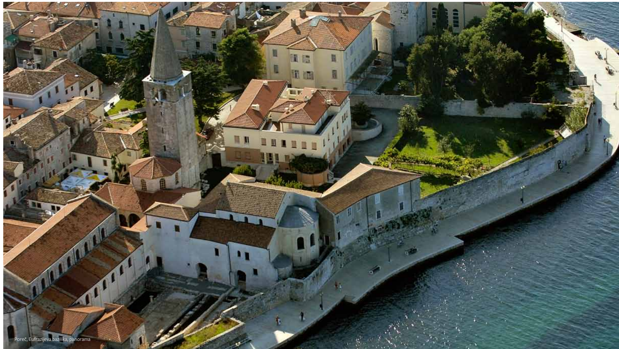
Poreč, Eufrazijeva bazilika, panorama

R imski Parentium, danas Poreč, osnovali su Rimljani na poluotrvu koje je već ranije bilo sporadično naseljeno. Mali rimski grad imao je pravilnu kvadratnu mrežu ulica, karda i dekmuna, koje su oblikovale blokove stambenih i javnih građevina. Forum je bio na vrhu poluotrvra, a na sjevernoj je strani u 3. vijeku oblikovan ranokršćanski sklop koji je u 4. vijeku dobio formu prave javne crkve. Porečki biskup Eufrazije sredinom 6. vijeka temeljito je preuredio tadašnji katedralni sklop i veliku baziliku opremio raskošnim zidnim mozaicima.