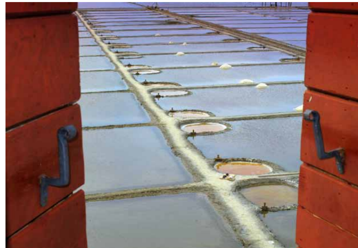
Sečovlje-Fontanigge, Cavedini – solane

obitava gotovo 300 vrsta ptica, od kojih se neke gnijezde u solanama; među njima može se primijetiti mala bijela čaplja ( Egretta garzetta ), simbol parka prirode Sečovlje.