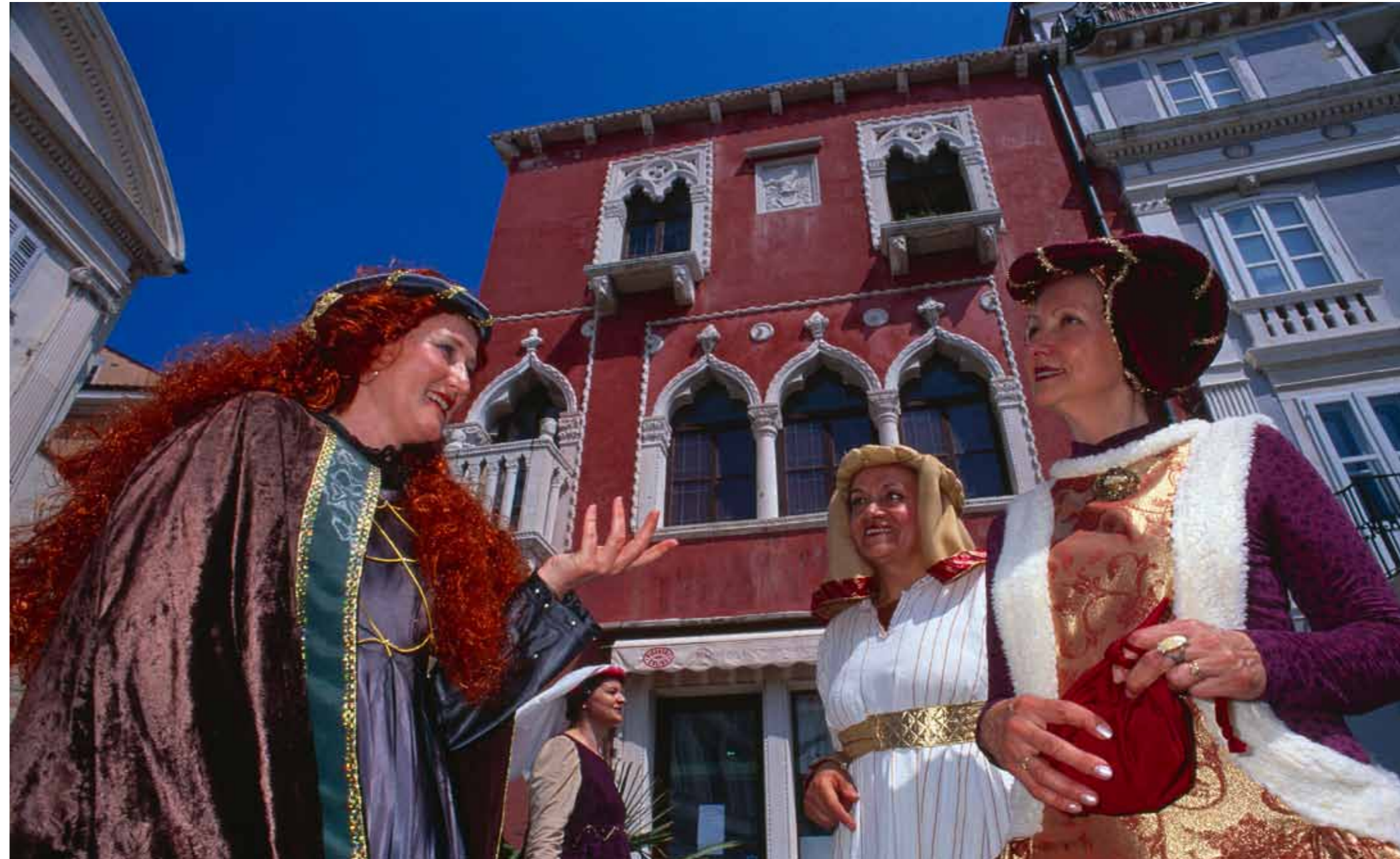
Piran, venecijanska palača

Piran se u pisanim izvorima prvi put spominje u 7. vijeku, zajedno s drugim istarskim gradovima ( Ravennatis Anonymi Cosmographia ). Čini se da se život u gradu odvijao kontinuirano, a da se mijenjala samo vlast: u 7. vijeku pod bizantijskom je vlašću, u drugoj polovini 8. vijeka, zajedno s Istrom, pao je pod franačku vlast, 952. godine uključen je u njemačko carstvo kao dio Furlanske marke. Nakon 1209. godine akvilejski je patrijarh postao istarski markgrof i vladar. Period relativne samostalnosti završio je 1283. godine kada je Piran pao pod venecijansku vlast. Dug, miran i povoljan period venecijanske vladavine završio je 1797. propašću Mletačke Republike. Nakon toga Istra i Piran postaju dijelom Küstenlanda u sklopu austrijskog carstva, odnosno Austro-Ugarske monarhije sve do 1918. godine. Nakon Prvog svjetskog rata, to je područje pripojeno Kraljevini Italiji. Grad je nakon Drugog svjetskog rata bio dio Zone B Slobodne teritorije Trst (1947–1954), a u okviru Londonskog memoranduma pripojen je Jugoslaviji. Nakon 1991. godine, u sastavu je Republike Slovenije.