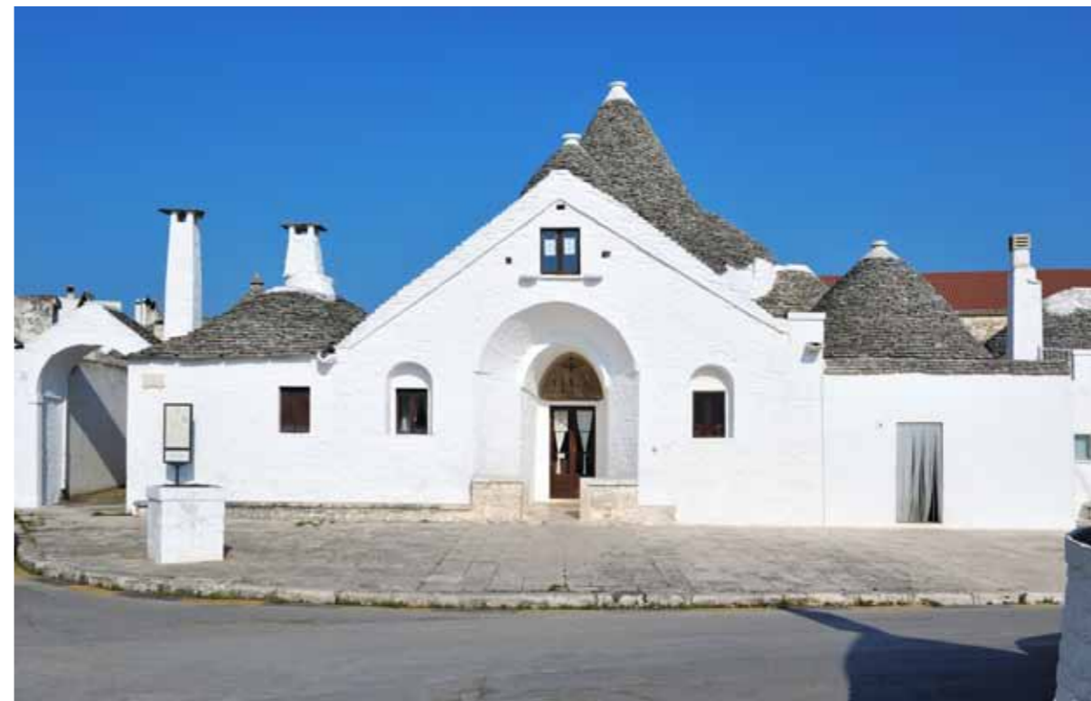
Alberobello, Trullo Sovrano

Upis trulla u Alberobellu na UNESCO-ov Popis svjetske baštine (World Heritage List), na temelju kulturnih kriterija (iii), (iv) i (v), u decembru 1996. godine Centar za svjetsku baštinu (World Heritage Centre) obrazložio je na sljedeći