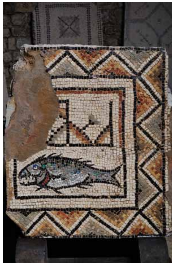
Poreč, Eufrazijeva bazilika, mozaik s motivom ribe

sa strane su anđeli i sveci mučenici. Natpisom je istaknut sveti Mauro, gradski zaštitnik. U pratnji svetaca i anđela prikazani su biskup Eufrazije s modelom bazilike u rukama, đakon Klaudije i njegov sin Eufrazije.