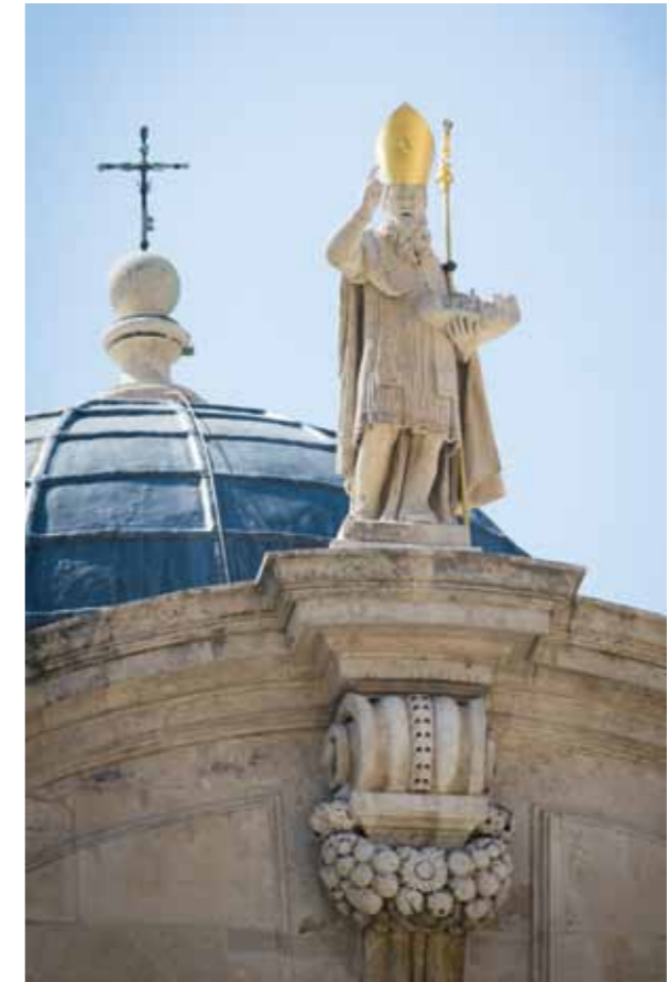
Dubrovnik, kip sv. Vlaha

Historijska jezgra grada s gradskim bedemima, utvrđenjima i jarkom registrirana je 1966. godine kao kulturno dobro u Hrvatskoj, a 1979. godine ona je uvrštena