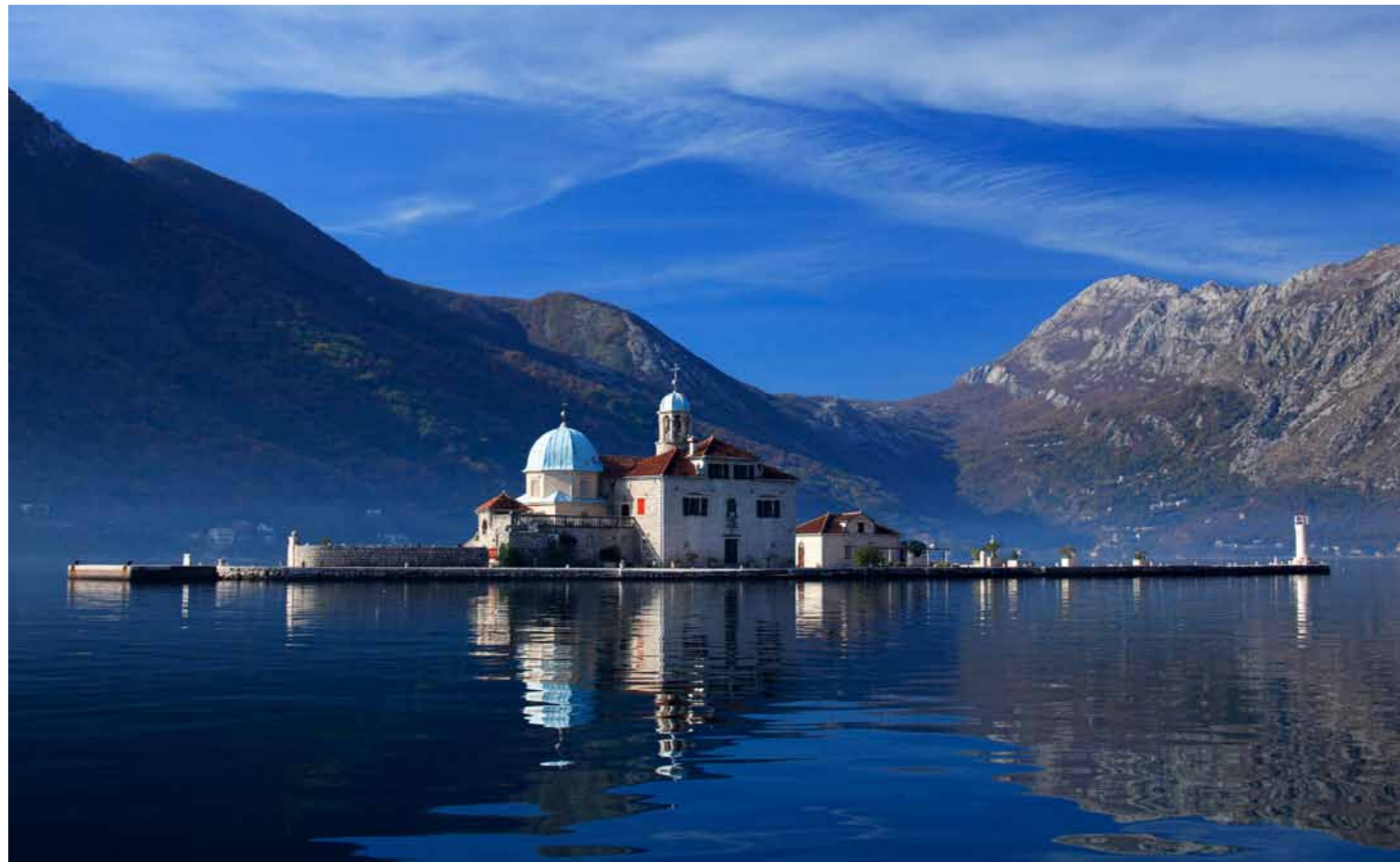
Otok Gospe od Škrpjela

Grad je imao svoj statut davne 1301. godine, koji je štampan 1616. godine u Veneciji. Nekad čuveno srednjovjekovno zanatsko središte, Kotor se danas diči mnogim slikovitim, nadsvođenim trgovinama s karakterističnim izlozima "na koljeno". Naročito u srednjovjekovno doba cvali su umjetnički i ostali zanati u brojnim radionicama. Osnivane su bratovštine (confraternities), a sirovine, posebno metal (za zlatare i kovače), koža i drvo dolazili su iz zaleđa. Bratovštine su istovremeno djelovale i kao vjerske organizacije i