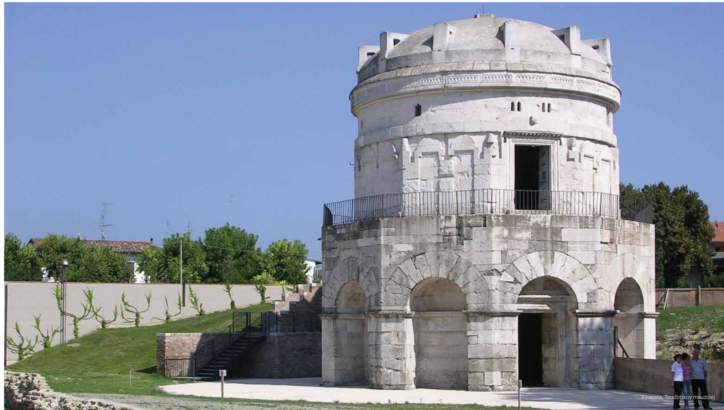
Ravenna, Teodorikov mauzolej

R avenna je proglašena UNESCO-ovim lokalitetom svjetske baštine kada je 1996. godine osam njenih spomenika iz 5. i 6. vijeka dodano na UNESCO-ov Popis svjetske baštine (World Heritage List). Ranokršćanski spomenici Ravenne smatraju se svjetskim blagom iz sljedećih razloga: "Lokalitet posjeduje iznimnu univerzalnu vrijednost od izuzetnog značaja zbog vrhunskog umijeća mozaičke umjetnosti u njenim spomenicima, kao i zbog presudnog svjedočanstva o umjetničkim i vjerskim vezama i dodirima u važnom razdoblju evropske kulturne historije."