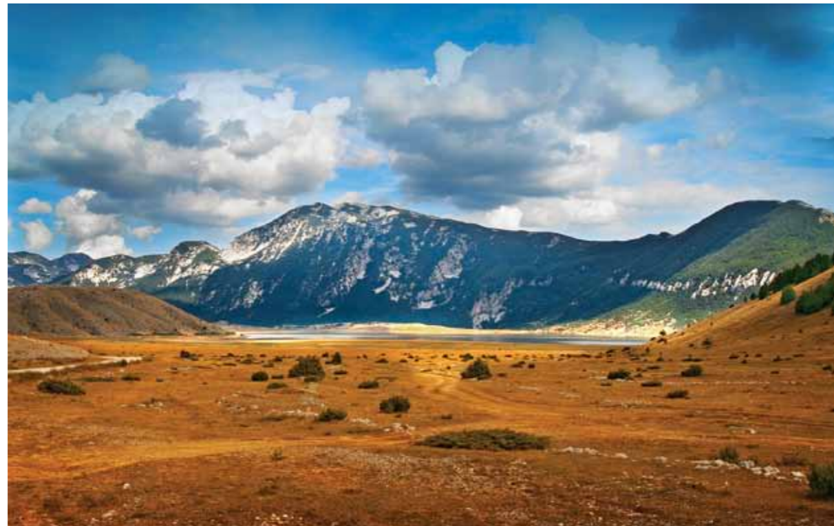
Blidinje, jezero i srednjovjekovna nekropola

znata njihovim upisivanjem na UNESCO Listu svjetskog naslijeđa, odnosno na UNESCO Tentativnu listu.