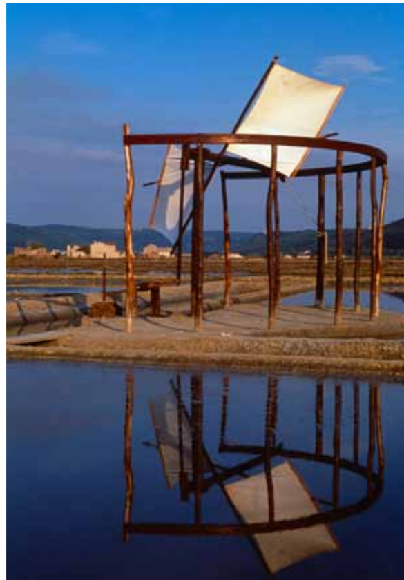
Sečovlje-Fontanigge, vodena pumpa na vjetar

motornim pumpama i transportom po uzoru na rudarsku tehnologiju, iako se proizvodnja soli i dalje temelji na tradicionalnim materijalima, od cavedina izgrađenih od solanskog blata do površinske kore petole . So se proizvodi isključivo uz pomoć sunca, vjetra i morske vode. Niz proizvoda poput cvijeta soli i aqua madre (visokokoncentrirane slanice) među najboljim su proizvodima u industriji soli.