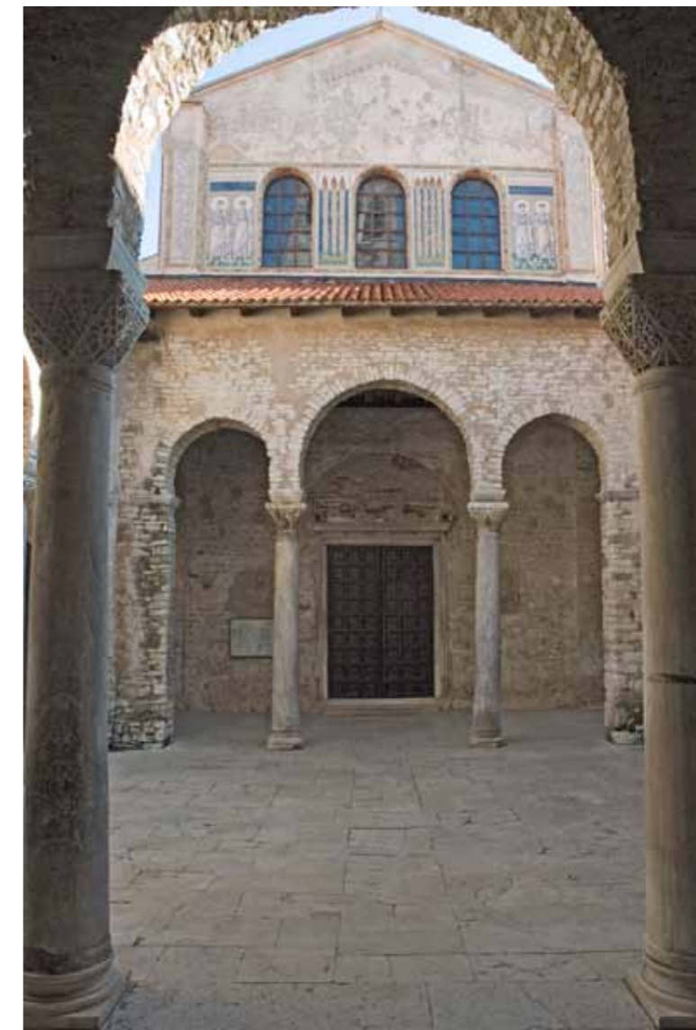
Poreč, Eufrazijeva bazilika, atrij i pročelje crkve

Sredinom 5. vijeka prva je crkva drastično preuređena i povećana. Tu fazu katedralnog sklopa nazivamo Predeufrazijanom. Ona se sastojala od dviju paralelnih trobrodskih bazilika, međusobno odijeljenih manjim prostorijama i cisternom. Ispred pročelja obiju bazilika protezao se dugački narteks s mozaičkim podom (motiv riblje kosti). Velika bazilika (južna) tlocrtno se poklapa sa sadašnjom bazilikom, osim u istočnom dijelu, gdje je završavala ravnim zidom. Podni mozaici Predeufrazijane sačuvani su ispod