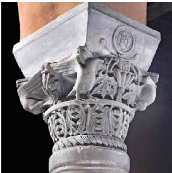
Poreč, Eufrazijeva bazilika, bizantski kapitel

poda sadašnje crkve (Eufrazijeve bazilike). U svetištu je bio sinthronos – polukružna klupa za svećenike i biskupa. Mozaički tepisi Predeufrazijane mogu se djelimično vidjeti kroz otvore na podu sadašnje crkve. Manja bazilika Predeufrazijane sačuvana je u arheološkim ostacima dijelova trijumfalnog luka i početka arkature uz njega. U razdoblju ranog srednjeg vijeka ta je crkva bila reducirana na prostor srednjeg broda, a u apsidu je postavljen veliki kameni sarkofag pod arkosolijem i zidani oltar uz njega. U drugoj fazi ranosrednjovjekovne adaptacije apsida je pregrađena umetanjem triju malih upisanih apsida. Tokom 14. vijeka ovaj je prostor uređen za sakristiju. Na zidovima se vide ostaci fresaka gotskog stila iz tog razdoblja. Sklopu Predeufrazijane pripada do danas sačuvana osmerostrana krstionica s ukopanim šesterostranim krsnim bunarom. Između krstionice i velike bazilike nalazilo se dvorište – atrij, a oko krstionice postojao je poligonalni ophod.