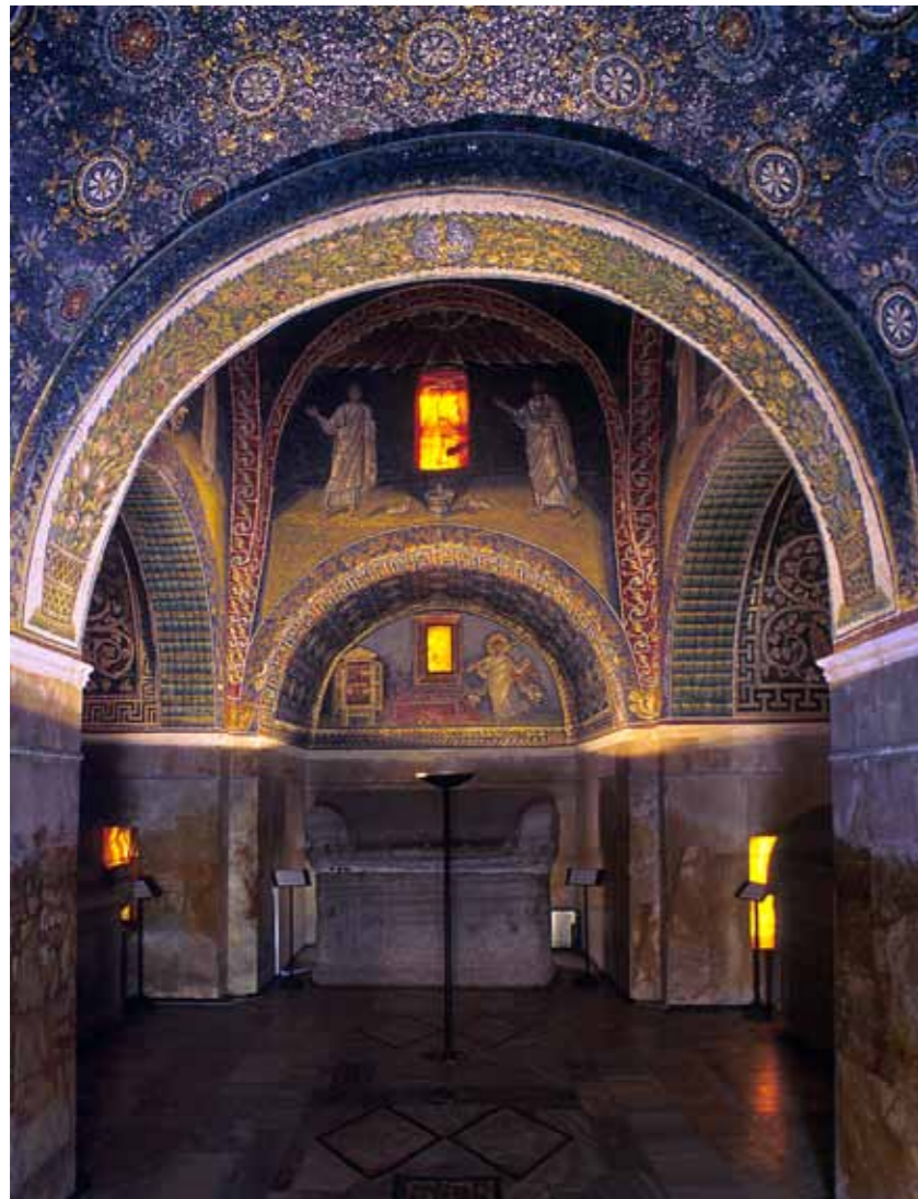
Mauzolej Gale Placidije, unutrašnjost

koje prikazuju šesnaest proroka: četiri veća i dvanaest manjih proroka. S ovim se ravenskim zdanjem po savršenstvu mozaika i strukturnoj očuvanosti ne može uporediti nijedna druga ranokršćanska krstionica. Mozaici su podijeljeni u tri trake. U centralnom je polju prikazano Kristovo krštenje u rijeci Jordan, druga traka prikazuje dvije povorke apostola s Petrom i Pavlom na čelu, a na trećoj su prikazani etimasia (prazno prijestolje koje očekuje Kristov drugi dolazak) i prazna sjedišta smještena unutar arhitekture vrta, koja simbolizira nebeski raj, mjesto koje očekuje duše u vječnom životu.