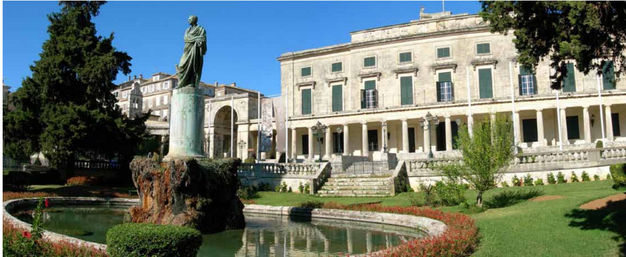
Krk, Palača sv. Mihovila i sv. Jurja

odluka iz 1980. godine) i općina Krk (predsjednička odluka iz 1981. godine).