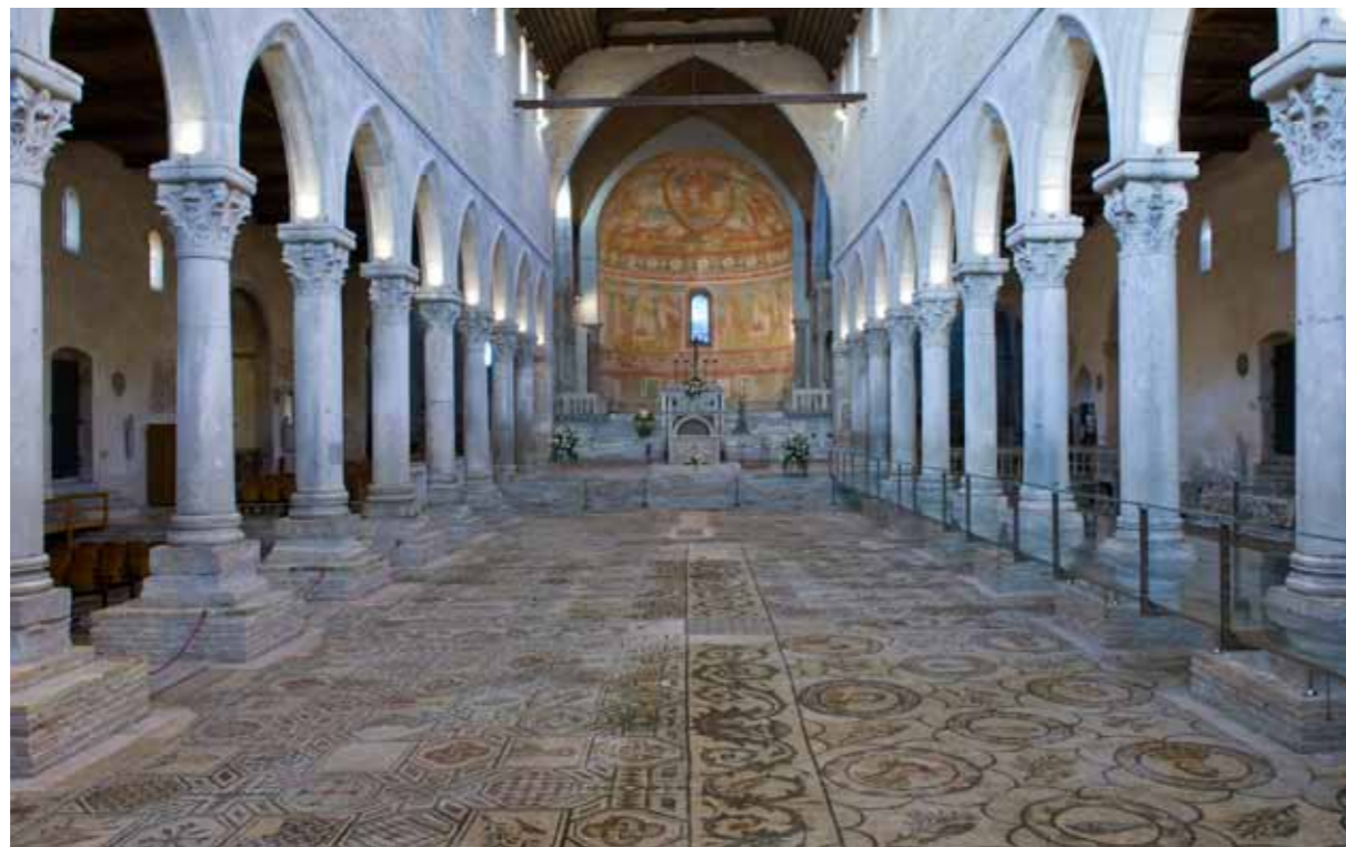
Akvilleja, podni mozaik bazilike

biskupskoj rezidenciji. Mozaik u južnoj Teodorovoj dvorani, površine oko 760 kvadratnih metara, najveći je mozaički pod na prostoru Zapadnog rimskog carstva. Podom podijeljenim u četiri prostorne cjeline dominira natpis posvećen Teodoru, a alegorijski prikazi i imaginarij skrivena značenja služe kao vodič ka vječnom spasenju.