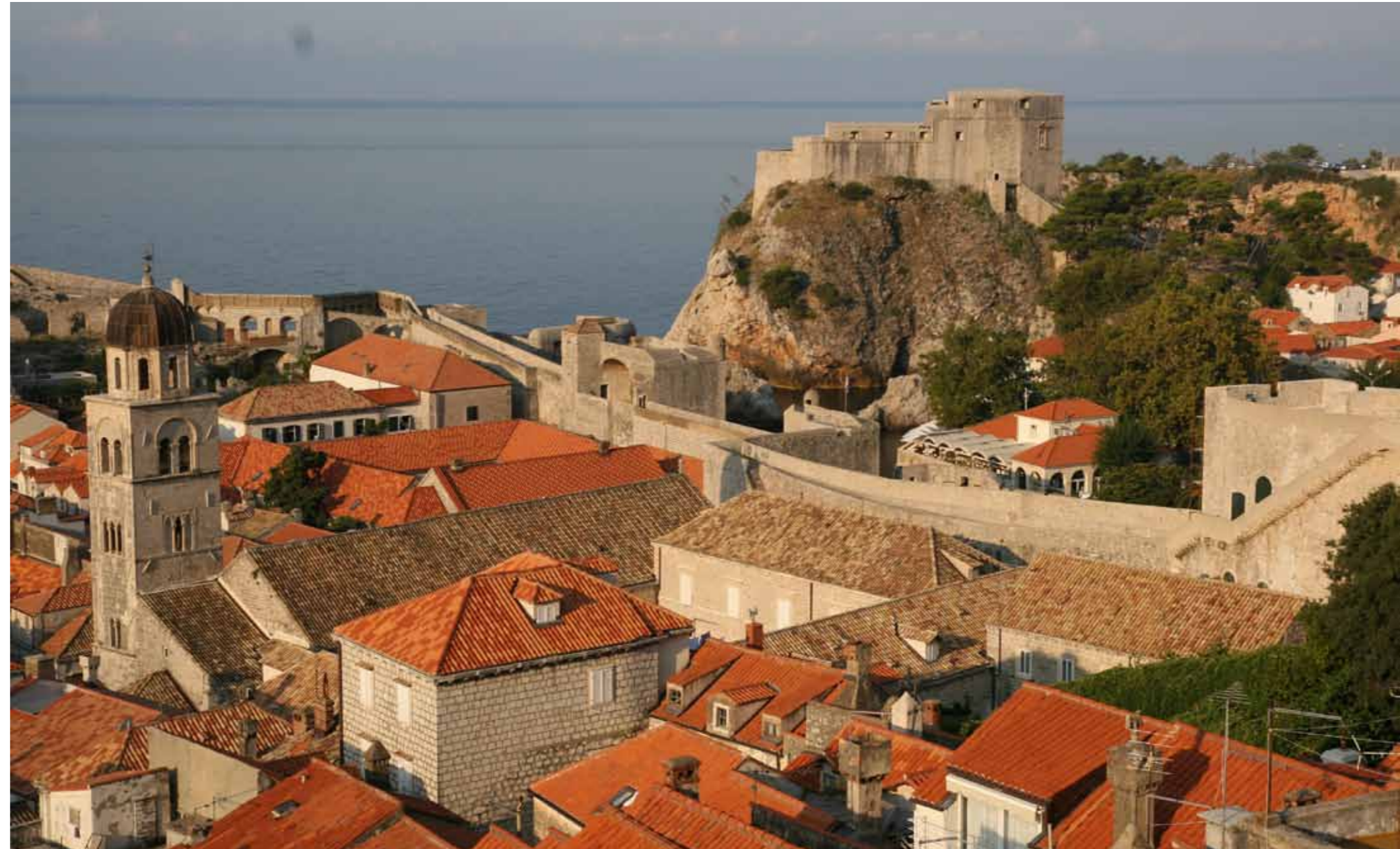
Dubrovnik, tvrđava Lovrijenac

Tokom arheoloških istraživanja otkriveni su zidovi koji su činili gradski bedem. Zidovi su srušeni kad su izgubili odbrambenu funkciju, a zemljište je nasuto sterilnim slojem zemlje i poravnano radi izgradnje ljevaonice. Ona je djelovala s prekidima od 15. vijeka nadalje sve do velikog zemljotresa 1667. godine, nakon kojeg je područje djelimično zatrpano šutom od ruševina okolnih kuća te se dalje koristilo kao odlagalište smeća. Zona u kojoj se nalazila peć nastavila je funkcionirati još kratko vrijeme, dok su se ostali dijelovi koristili sporadično i neplanski sve dok ljevaonica konačno nije potpuno zasuta. Rastopljeni metal koristio se za lijevanje zvona, topova, topovskih kugli i ostale opreme arsenala Republike. Nije se proizvodilo samo za domaće potrebe, već i za izvoz u Španiju, s kojom je Dubrovnik oduvijek njegovao čvrste veze. Izvozilo se i u Italiju i Veneciju, s kojima su dobri trgovački odnosi nadjačali i preživjeli mnogobrojne prolazne sukobe proizašle iz preklapanja interesa i težnji. Područje tanglija zasuto je u nekoliko navrata, što je stvorilo jasan stratigrafski slijed. Iskopavanja su potvrdila pretpostavku o postojanju koncentrirane srednjovjekovne i novovjekovne industrijske aktivnosti u ovom dijelu Grada.