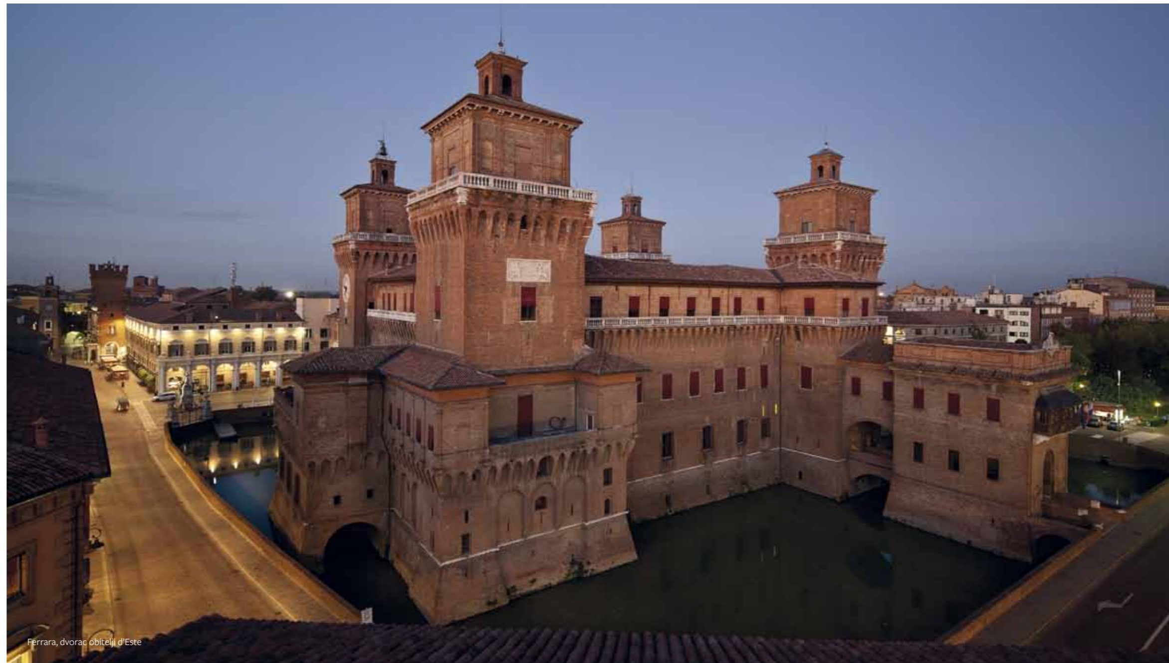
Ferrara, dvorac obitelji d'Este

Na 19. sjednici Komisije za svjetsku baštinu (Committee for World Heritage) održanoj u Berlinu 1995. godine grad Ferrara pridodan je na popis prema kriterijima (ii), (iv) i (vi) kao "lokalitet od izuzetne univerzalne vrijednosti, izvrsno planiran renesansni grad, čije je urbano tkivo očuvano gotovo nedirnuto. Dosezi u urbanom planiranju utjelovljeni u Ferrari imali su dubok utjecaj na razvoj urbane sheme u narednim vijekovima". Upis se odnosio na gradsko središte unutar njegovih monumentalnih zidina, sa očuvanim unutrašnjim dvorištima i parkovima.