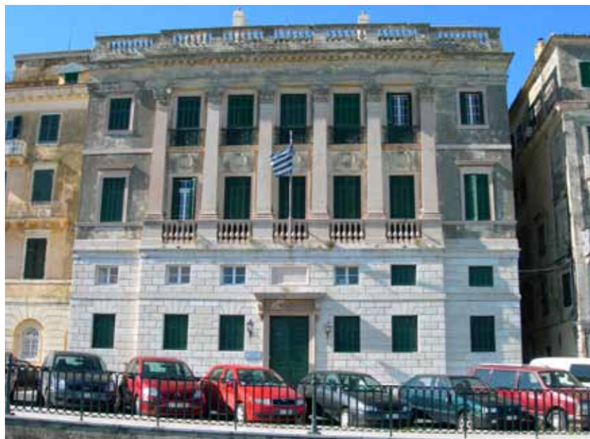
Krf, Palača Kapodistrias

Mir u Campo Formiu (1797. godine) označio je kraj Republike Venecije, a Krf dolazi pod francusku upravu (1797–1799), sve do povlačenja Francuske pred rusko-turkskim savezom, koji je osnovao Sjedinjene Države Jonskih Ostrva , s glavnim gradom u Krfu (1799–1807). Iscrtavanje teritorijalnih granica u Evropi nakon pada Napoleona, poslije kratkog međurazdoblja obnovljene francuske vlasti (1807–1814), učinilo je Krf sljedećih pola vijeka britanskim protektoratom (1814–1864). Kao glavni grad Sjedinjenih Država Jonskih Ostrva Krf je izgubio strateški značaj. Pod upravom britanskog visokog povjerenika sir Thomasa Ma-itlanda (1816–1824) građevinske su aktivnosti bile usmjerene na Spianadu. Njegov nasljednik sir Frederic Adam (1824–1832) posvetio se javnim radovima (izgradnji vodovoda, rekonstrukciji Stare citadele i izgradnji novih vojnih građevina na mjestu venecijanskih, obnovi i izgradnji novih