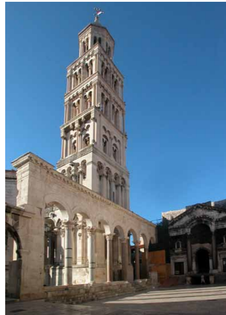
Split, Dioklecijanova palača, Peristil i zvonik