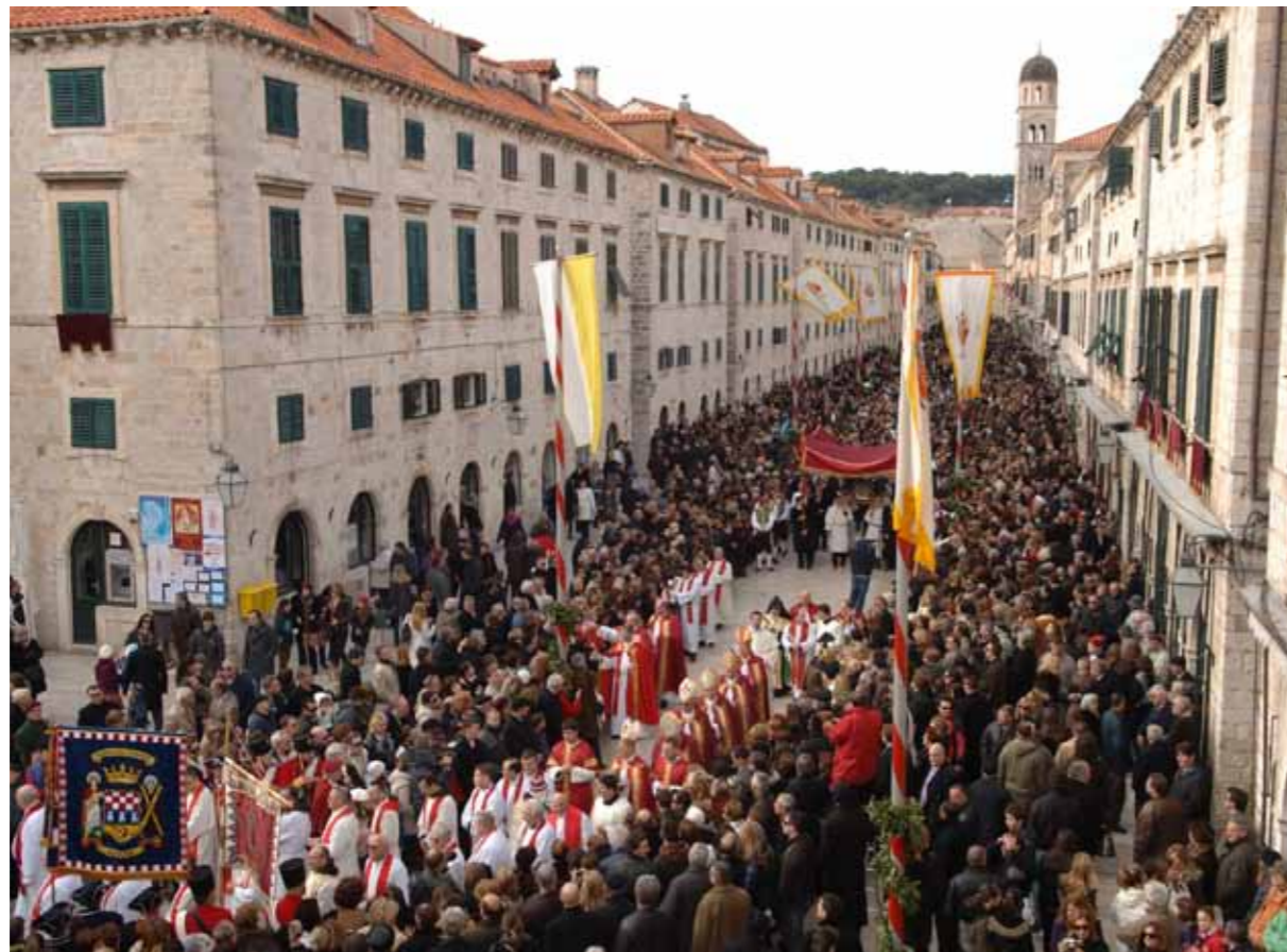
Dubrovnik, Festa sv. Vlaha, procesija

Prvobitno je naselje nastalo na najvišem dijelu poluostrva na području danas zvanom Sveta Marija, koje je bilo povezano s kopnom na zapadu, a štitilo je duboki zaliv veoma pogodan za sidrenje. Položaj koji su prema moru omeđivale strme hridi visoke i do 35 metara, a sa sjeverne strane velika i dovoljno strma prirodna padina pružao je relativnu sigurnost naselju budući da se neprijatelj, osvajač ili pljačkaš koji bi se približio s kopna ili mora mogao na vrijeme uočiti. To je bila strateška pozicija koja je davala izuzetnu mogućnost nadzora nad brodovima koji su plovili istočnojadranskim plovidbenim pravcem poznatim već u antičko doba. Zaštićen zaliv s dobrim sidrištem i padine poluostrva sa izvorima pitke vode omogućili su razvoj života i blagostanje naselja. Prema legendi, izvorno je naselje utvrđeno na strani okrenutoj prema kopnu najprije palisadom, a kasnije suhozidom.