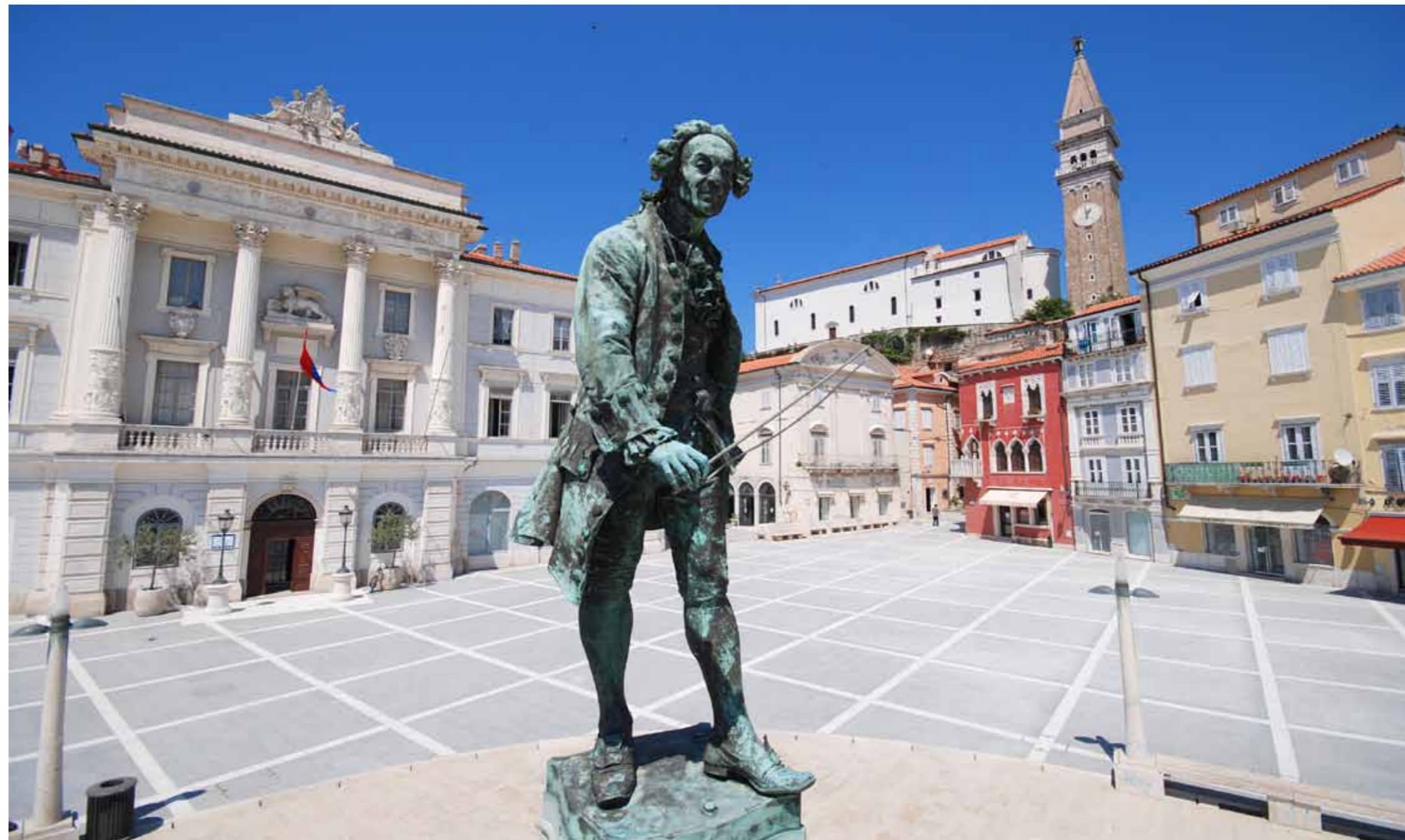
Piran, Tartinijev kip na glavnom trgu