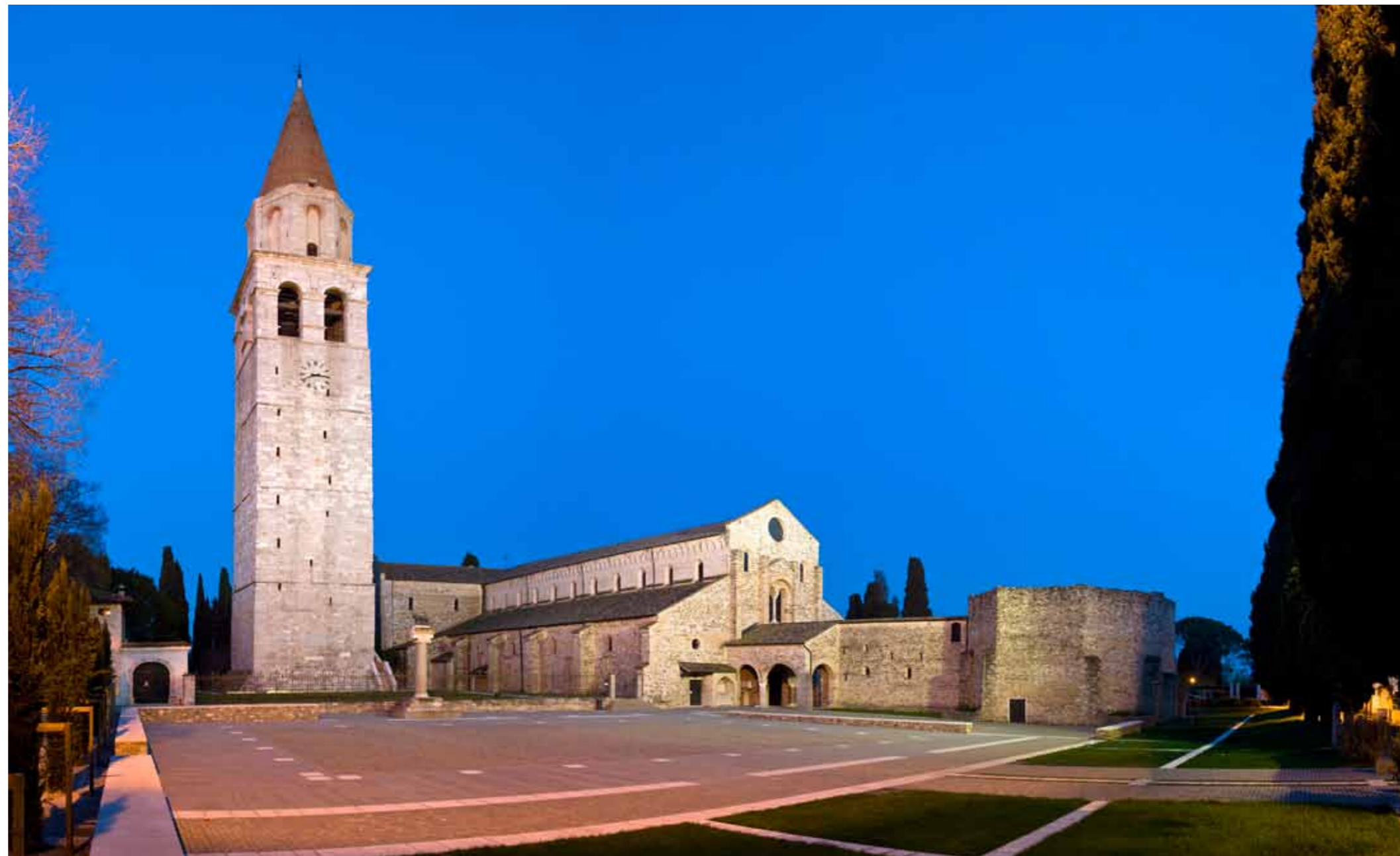
Akvileja, patrijarhalna bazilika i trg Capitolo

Podni mozaici u bazilici, otkriveni u razdoblju od kraja 19. vijeka i prvih decenija 20. vijeka, jedan su od najupečatljivijih tragova izvorne crkve, izgrađene po nalogu biskupa Teodora odmah nakon proglašenja Milanskog edikta o suživotu 313. godine. Sklop se sastojao od dviju naporednih dvorana (druga se može vidjeti u Kripti iskopina) povezanih poprečnom dvoranom, približno eliptične krstionice (zatvorene za javnost), te raznih prostorija koje su mogle pripadati