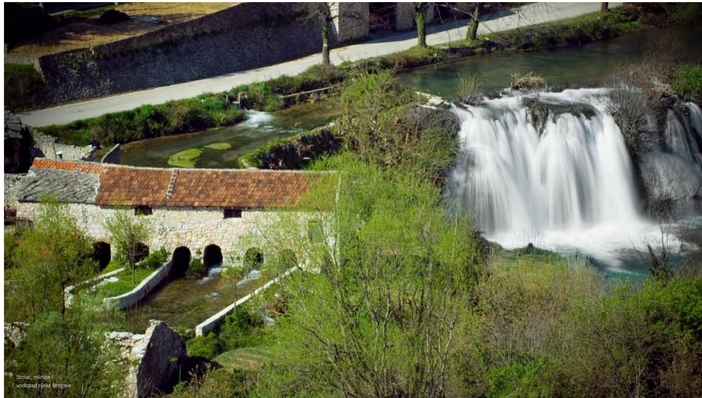
Stolac, mlinice i vodopad rijeke Bregave

J užni dio Bosne i Hercegovine karakteriše brojnost, vrijednost i raznolikost arheološkog i arhitektonskog naslijeđa te kontinuitet života koji na pojedinim lokalitetima počinje još u paleolitu. Među najznačajnijim lokalitetima se izdavaju Mostar, Stolac, Počitelj, Ljubuški, Blagaj, Zavala, Blidinje. Posebnost navedenih lokaliteta jeste utjecaj prirodnog faktora na oblikovanje urbane morfologije. Nastali na obalama Radobolje, Neretve, Bregave, Trebižata, Bune ili u blizini pećine Vjetrenica i glečerskih jezera na Blidinskom polju, ovi lokaliteti, svojom morfologijom i vernakularnom arhitekturom svjedoče o viševjekovnoj uzajamnoj saradnji i interakciji čovjeka i prirode. Vrijednost pojedinih lokaliteta je prepo-