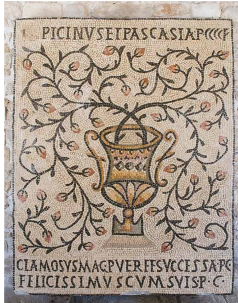
Poreč, Eufrazijeva bazilika, podni mozaik

Novo troapsidalno svetište u potpunosti je bilo pokriveno velikom mozaičkom kompozicijom. Ikonografski program glavne apsida sastoji se od prikaza Krista s apostolima na trijumfalnom luku, niza medaljona s portretima svetica u trijumfalnom luku i velikih slika u samoj apsidu. U kaloti je prikazan Krist kojeg drži Bogorodica na prijestolju, a