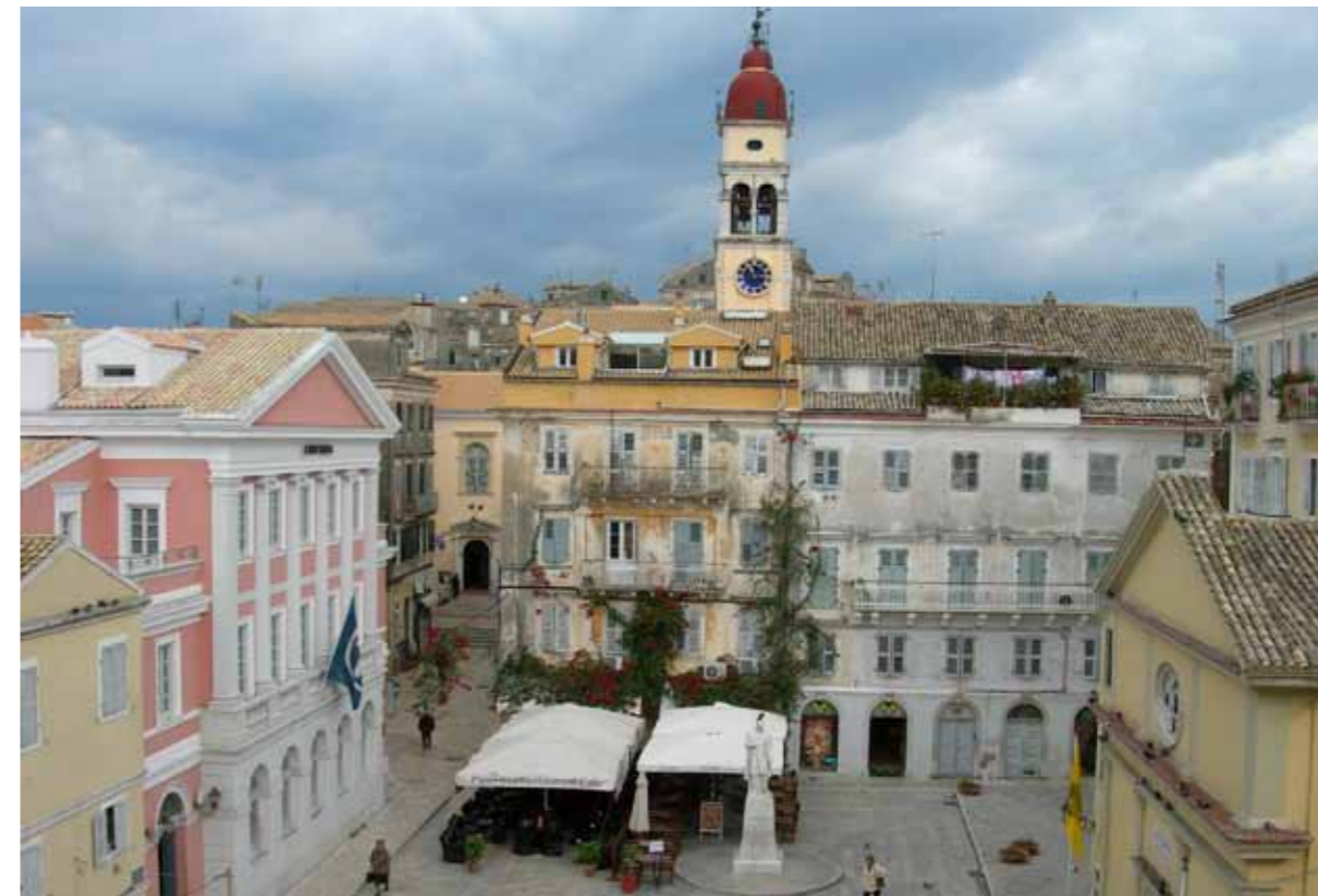
Krf, Trg heroja borbe za Cipar

cjelina visoke estetske vrijednosti nominirana je za upis na Popis svjetske baštine (World Heritage List) 31. jula 2007. godine, a grčko Ministarstvo kulture proglasilo ga je "historijskim spomenikom predviđenim za zaštitu". Cjelina fortifikacija i staroga grada Krfa nalazi se na strateškom položaju na ulazu u Jadransko more. Historijski korijeni grada sežu u 8. vijek prije nove ere i u bizantijski period. Grad je bio izložen različitim utjecajima i mješavini različitih naroda – od 15. vijeka Krf je oko četiri vijeka bio pod mletačkom vlašću, da bi se potom izmjenjivale francuska, britanska i grčka vlast.