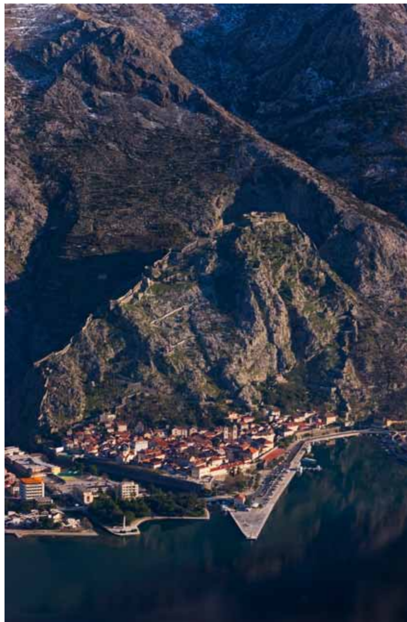
Kotor i brdo Sveti Ivan