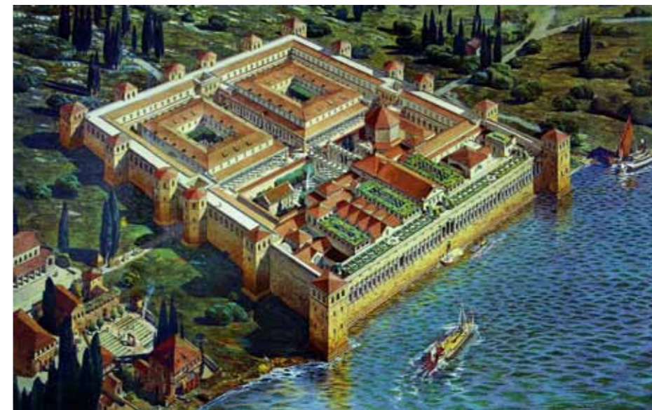
Split, rekonstrukcija Dioklecijanove palače (Hébrard 1912.)

Dioklecijanova palača dovršena je 305. godine kao sinteza oblika i funkcije kasnoantičke ville i utvrđenog castruma . Smatra se jednom od ključnih građevina kasnoantičke arhitekture zahvaljujući izuzetnoj očuvanosti izvornih dijelova i cjeline, te zahvaljujući nizu arhitektonskih oblika na prijelazu iz klasične u srednjovjekovnu umjetnost. Nakon transformacije u srednjovjekovni grad, u palači se podižu mnoge građevine raznih arhitektonskih stilova unutar odbrambenih zidina, djela majstora graditelja nadahnutih ovim veličanstvenim antičkim uzorom. Historijska jezgra Splita je 1979. godine proglašena lokalitetom svjetske baštine zahvaljujući očuvanoj arhitekturi iz svih razdoblja, ali i zahvaljujući tome što ona još uvijek predstavlja živi organizam sa svim gradskim funkcijama. No, ona je i