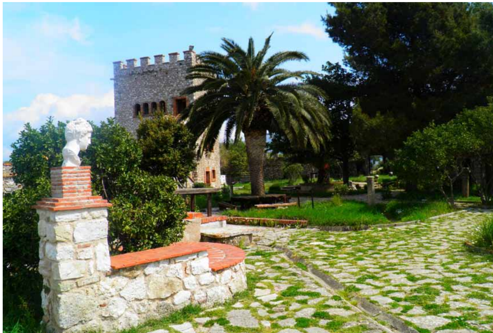
Butrint, venecijansko utvrđenje