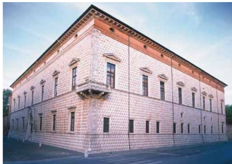
Ferrara, Dijamantna palača

Urbana matrica rezultat je promjena unesenih u srednjem vijeku i u kasnijim razdobljima, a posebno se to odnosi na renesansno proširenje koje je osmislio Biagio Rossetti. Njegova je shema uključivala sistem perspektivnih osa koje grad čine jedinstvenim, a koje su i danas savršeno očuvane i lahko uočljive posjetiocima. U skladu