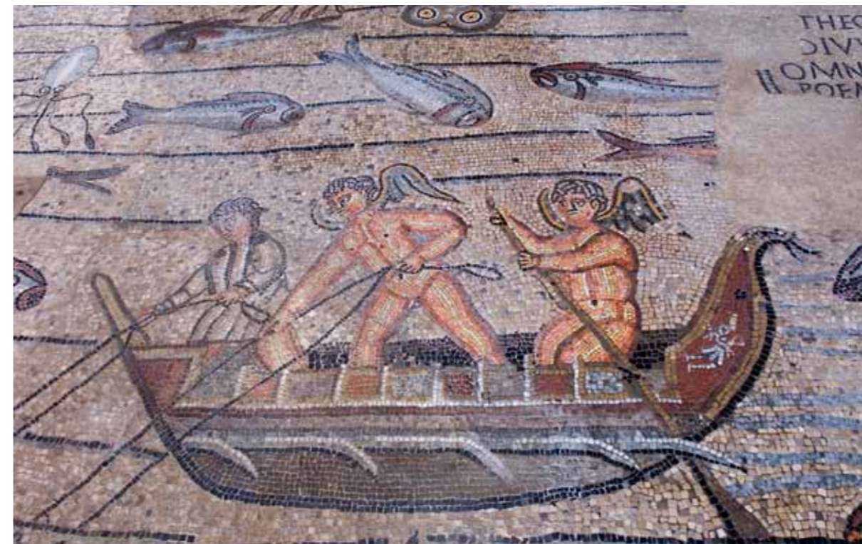
Akvilleja, biblijska priča o Joni, podni mozaik bazilike

koja je izgrađena sredinom 4. vijeka kako bi zamijenila Teodorovu crkvu.