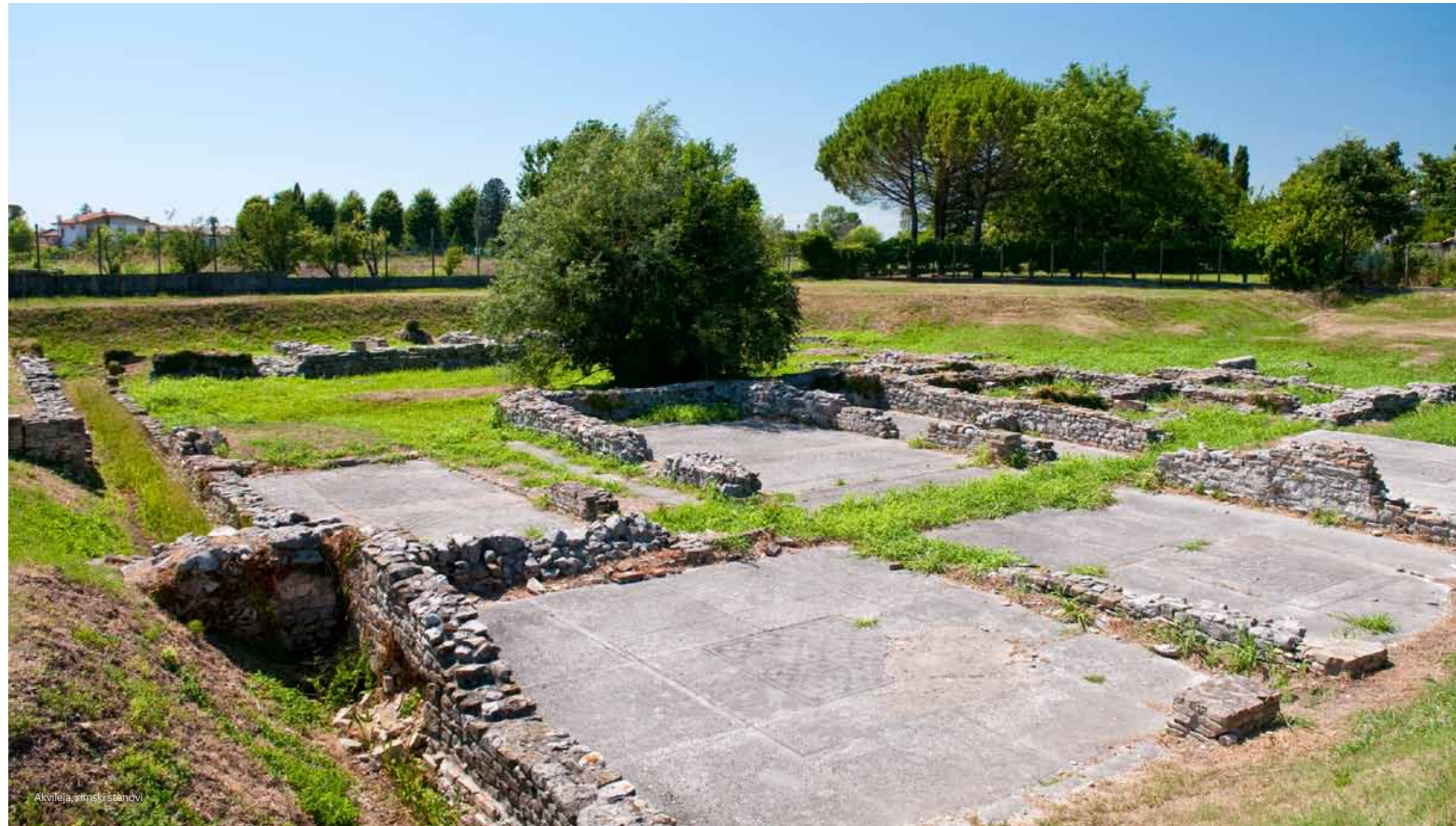
Akvileja, rimski stanovi

Odbor za svjetsku baštinu (The World Heritage Committee) prepoznao je Akvileju kao jedan od najvećih i najbogatijih gradova Rimskog carstva, cjelovit primjer antičkog rimskog grada na sredozemnom području, uglavnom neditnutog i sačuvanog pod zemljom, ali i utvrdio da sklop patrijarhove bazilike dokazuje presudnu ulogu Akvileje u širenju kršćanstva širom Evrope u ranom srednjem vijeku.