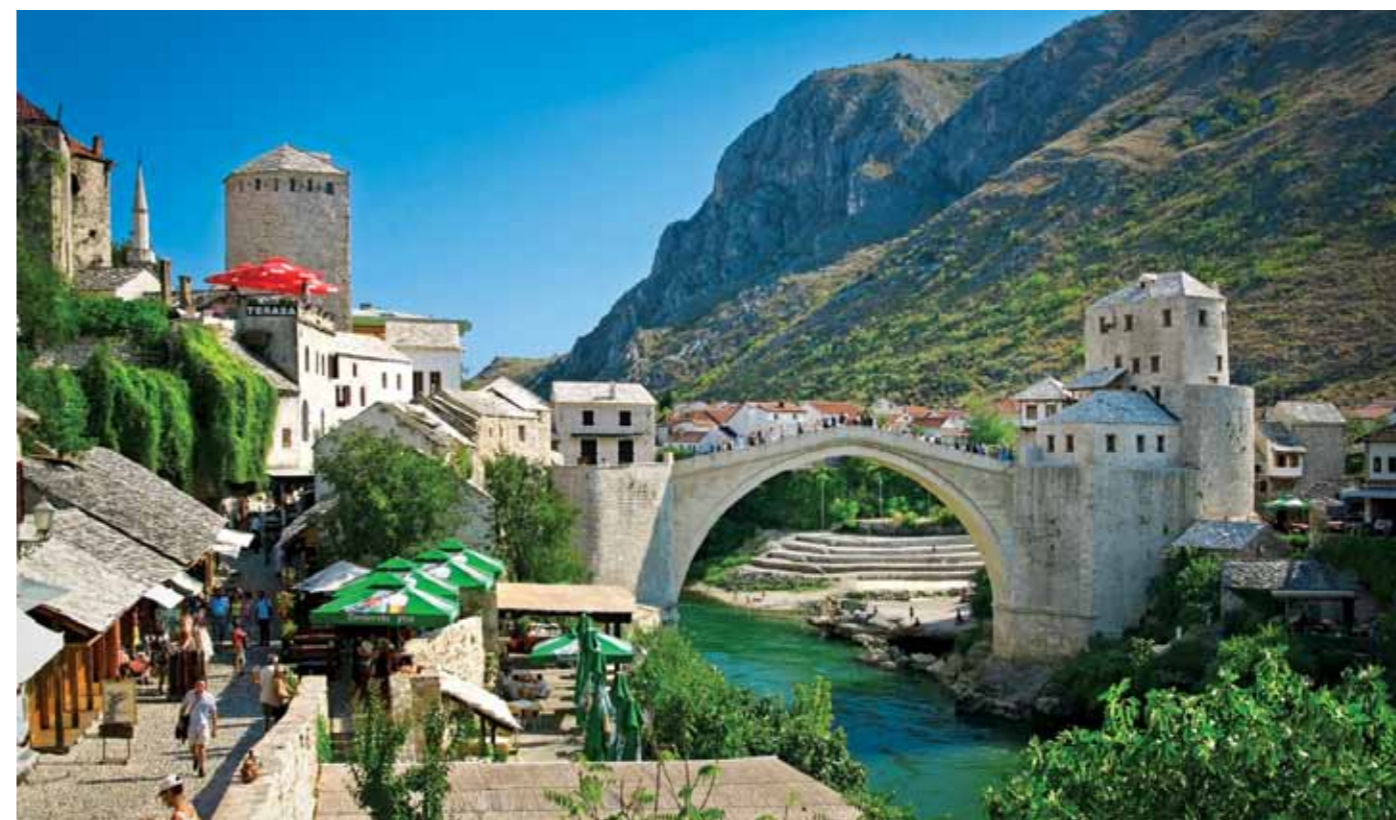
Mostar, Stari most

Sa “renesansom” Starog mosta i njegovog okruženja, simbolična snaga i značenje grada Mostara – kao izuzetnog i univerzalnog simbola suživota zajednica različitog kulturnog, etničkog i religijskog porijekla – je učvršćena i ojačana, uz naglasak na neograničene napore ljudske solidarnosti za mir i snažnu saradnju pri suočavanju sa teškim katastrofama.