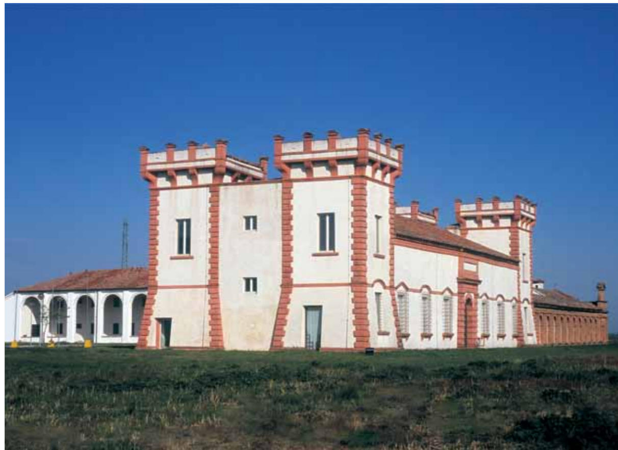
Rezidencija «Delizia del Verginese»

lovnim poduhvatima. Delizia del Verginese u mjestu Portomaggiore obilježena je četirima kulama s kruništima i istaknutim uglovnocima. Delizia di Benvignante u Argenti ima nadsvodeni ulaz i atrij te kulu s kruništem.