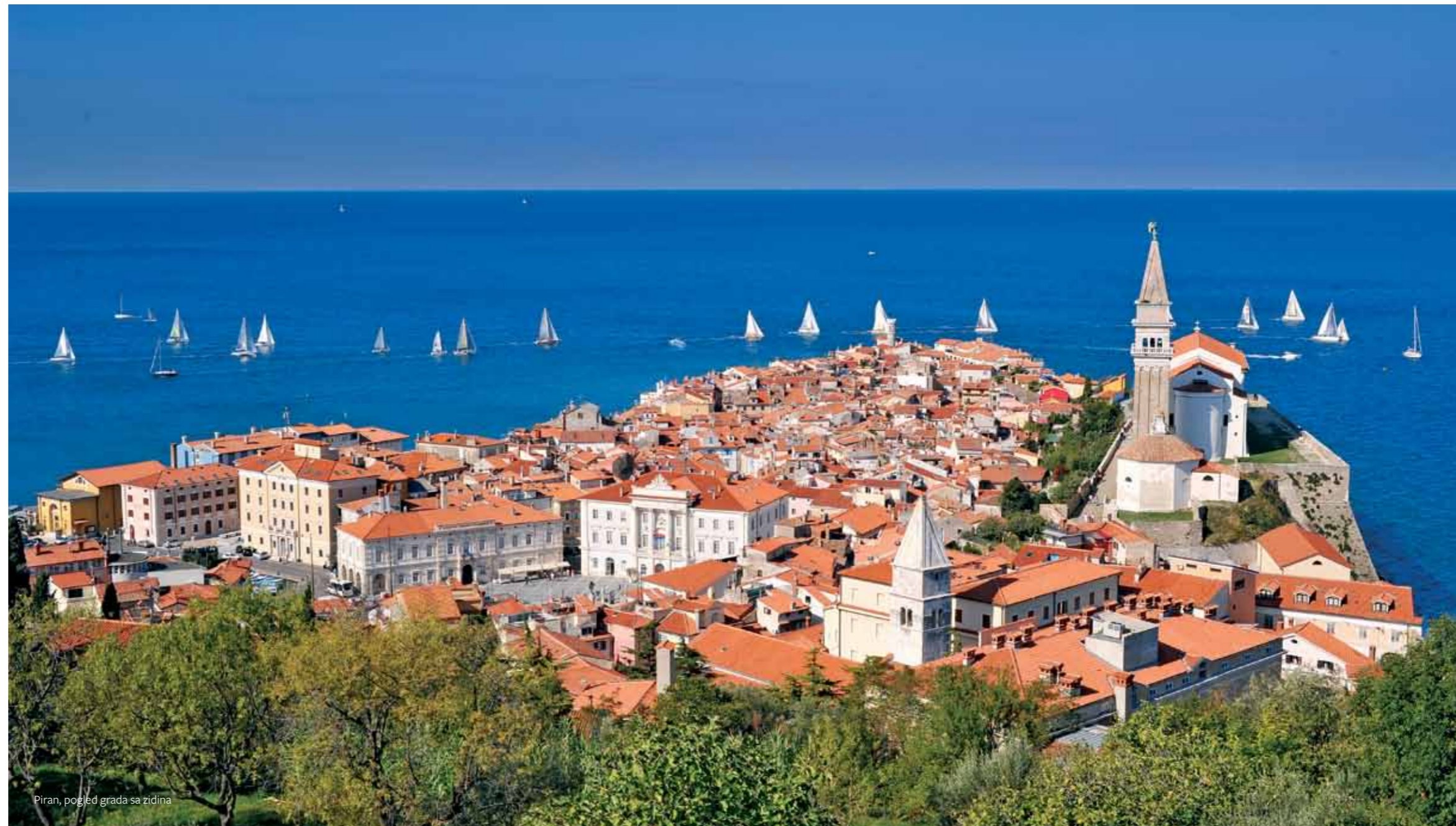
Piran, pogled grada sa zidina

Piransko poluostrvo ima vrlo povoljan položaj – planinski greben na sjevernoj strani štiti ga od bure, a strma padina i zaliv na istočnoj strani omogućavaju dobar pregled nad jedinim prilazom s kopna, zbog čega je bilo naseljeno već u prahistoriji. U pličinama oko Rta Madona pronađen je kameni bodež iz bronzanog doba, a na starom gradskom trgu pronađeni su nalazi iz srednjeg bronzanog doba.