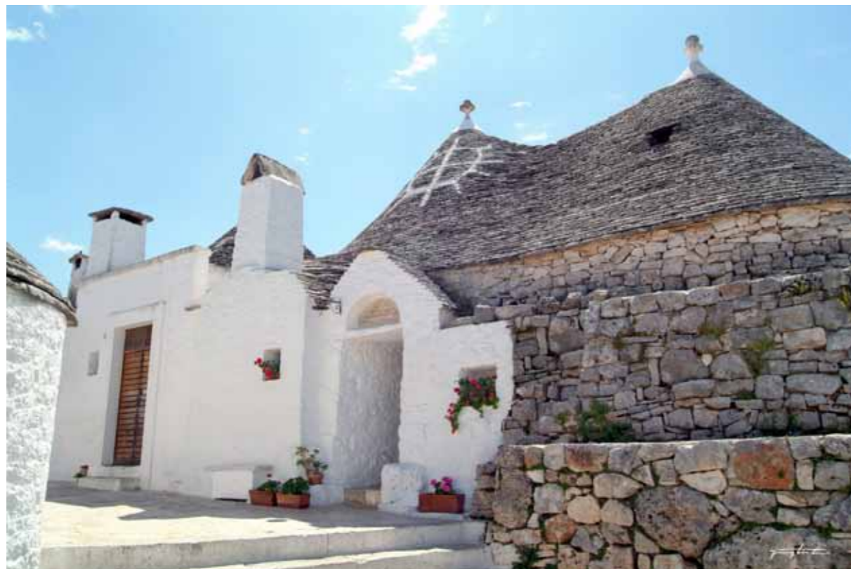
Alberobello, Trullo, simbol na krovu