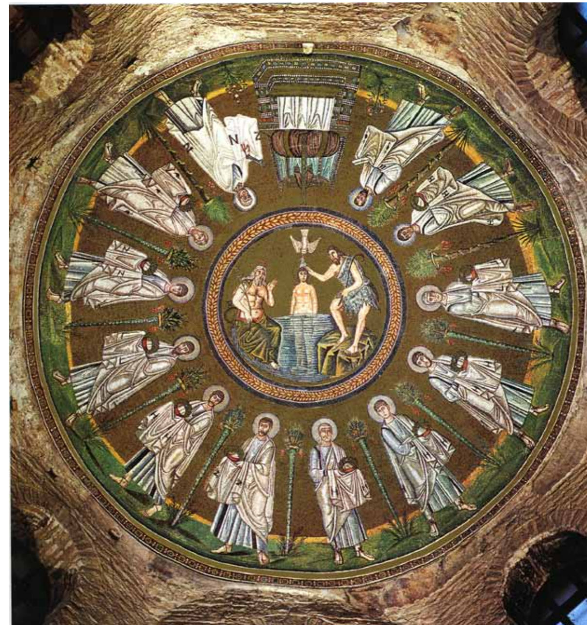
Ravenna, Arijska krstionica, mozaik kupole

Sagrađena krajem 5. vijeka za Teodorikove vladavine kada je arijanski kult bio službena dvorska religija, krstionica ima osmerougaoanu osnovu i sadrži prekrasne mozaike s prijelaza iz 5. u 6. vijek. Prelijepi mozaik u kupoli prikazuje Kristovo krštenje u rijeci Jordanu i dvanaest apostola. Prema arijanskoj je doktrini Krist bio Sin Božiji, ali je zadržao svoju ljudsku prirodu. Ovdje apostoli, koji u rukama nose krune života – slave – pobjede kao i u drugoj krstionici, nisu odvojeni kandelabrima kao simbolima svjetla, već palmama koje simboliziraju život. U arijanskom je shvaćanju ovaj Krist okrenut prema istoku, Krist koji postaje Bog u trenutku krštenja u Jordanu i kojeg je božanskim učinila praiskonska voda, obnavljajuće praiskonsko biće na kojem počiva Duh Božiji.