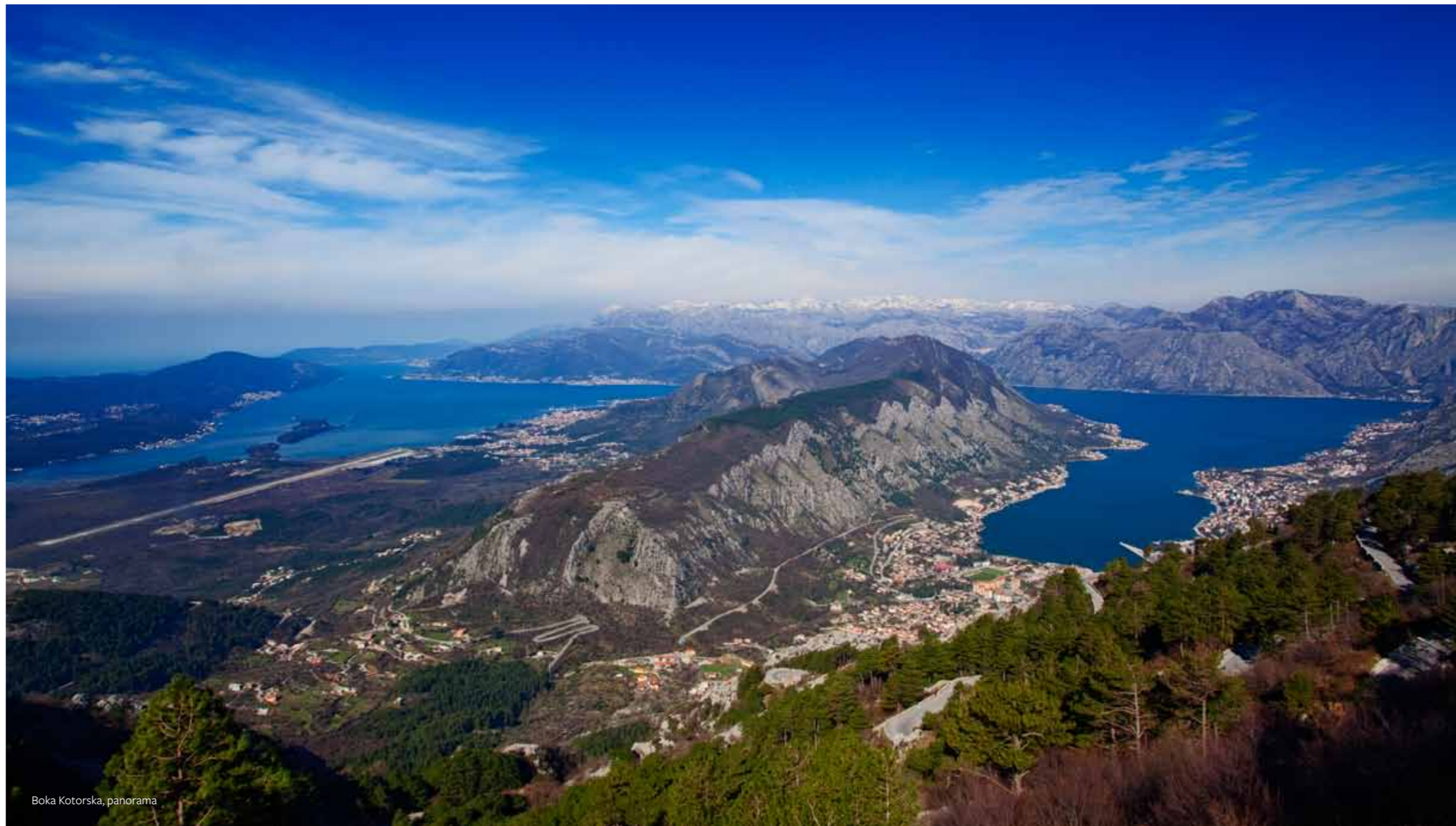
Boka Kotorska, panorama

P rirodno, kulturno i historijsko područje Kotora sastavni je dio impresivne Boke kotorske, jedinstvene prirodne luke na istočnoj crnogorskoj obali Jadrana . Zahvaljujući svojoj izuzetnoj i univerzalnoj vrijednosti, uvršteno je u UNESCO-ov Popis svjetske baštine 1979. godine. Definicija utjecajnog područja 2011. godine obuhvatila je čitav zaliv. Prirodno i kulturno-historijsko područje Kotora predstavlja skladnu kombinaciju razno-likih prirodnih fenomena i izgrađene baštine. Uz Kotorski in Risanski zaliv, sastavni dio zaštićenog područja, Boka kotorska također obuhvata Tivatski zaliv i Hercegnovski zaliv. Svojim raznovrsnim i osebnim prirodnim, geografskim, historijskim i kulturnim obilježjima, Boka kotorska predstavlja kulturni pejzaž izuzetne i sveopće vrijednosti.