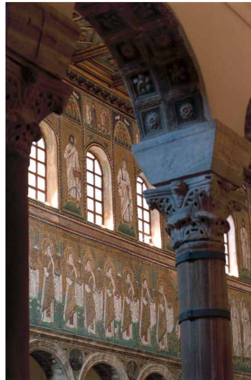
Ravenna, Sant' Apollinare Nuovo. unutrašnjost s mozaicima