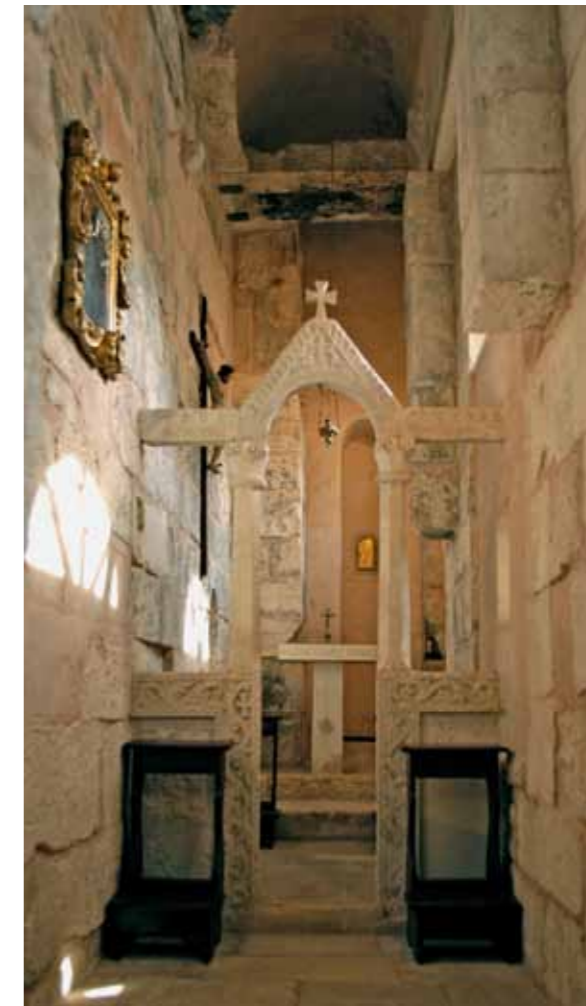
Split, Dioklecijanova palača, Crkva sv. Martina

Usljed neodržavanja, u posljednje se vrijeme stanje građevine rapidno pogoršalo. Stanje zapadnog zabata bilo je najalarmantnije, tako da se nekoliko blokova kamenog vijenca težine između 3 i 6 tona podiglo zbog korodiranih trnova, kliznulo niz kosinu zabata i opasno se nagnulo prema vani. Obnova hrama izvedena je kombinacijom tradicionalnih tehnika i savremene logističke podrške. Izrađen je 3-D kompjuterski model analize strukturalnog ponašanja. Kako bi se zaustavilo daljnje pomicanje struktura i brzo propadanje kamena i ponovo uspostavila stabilnost i izvorni raspored tereta, zapadni zabat i dio vanjskog kamenog vijenca morali su biti demontirani i popravljeni koristeći tradicionalne metode, te vraćeni na mjesto. Željezni trnovi zamijenjeni su elementima od nehrđajućeg čelika i zaliveni olovom na tradicionalan način, a fino rezbareni ukrasi portala i frizova na pročeljima očišćeni su laserom.