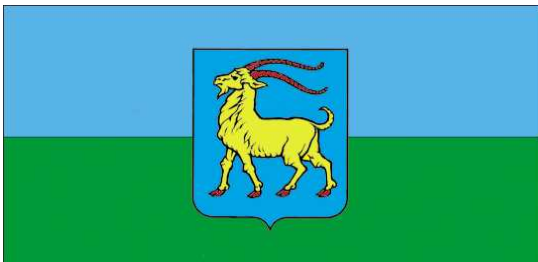
Zastava Istarske županije