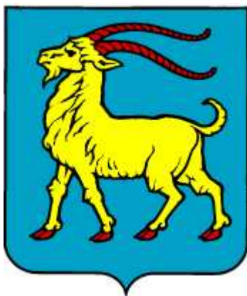
Grb Istarske županije