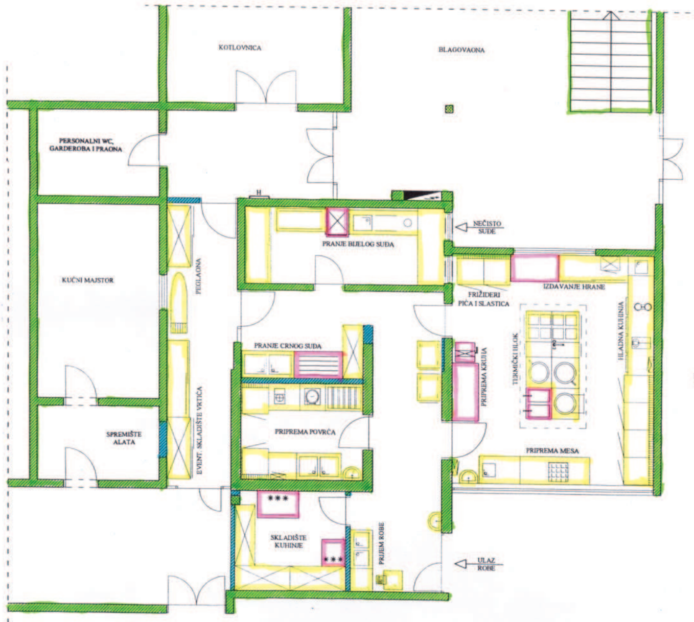
Dječiji vrtić i škola - NOVIGRAD tehnološko rješenje kuhinje M 1:100