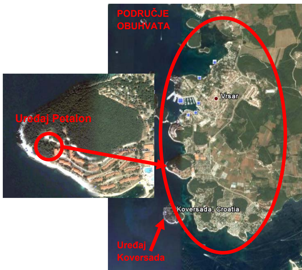
Sl. 1-1 Granice obuhvata podsustava Petalon i otok Koversada

Podsustav Petalon pokriva oko 95% pripadnog stanovništva (prema popisu iz 2001. godine ovo područje je imalo 1.872 stanovnika), dok priključenost na izgrađeni sustav iznosi oko 95%. Podsustav Petalon u postojećoj fazi prikuplja otpadne vode duž zapadnog dijela Općine Vrsar koje se proteže od uvale Fajbanna sjeveru do turističkog kompleksa Koversada, odnosno Limskog kanala na jugu.. Podsustav Petalon je izveden kao razdjelna kanalizacija, kojom se odvede isključivo sanitarne (fekalne) otpadne vode iz kućanstava i manjih privrednih djelatnosti, uključivo i turističke sadržaje.