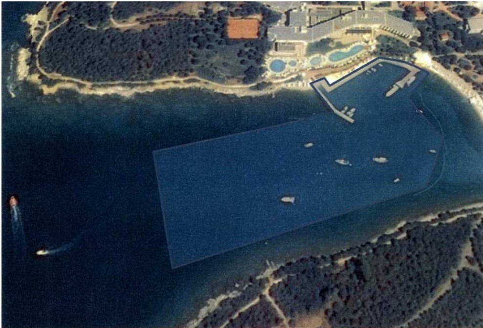
Nautički vezovi i sidrište