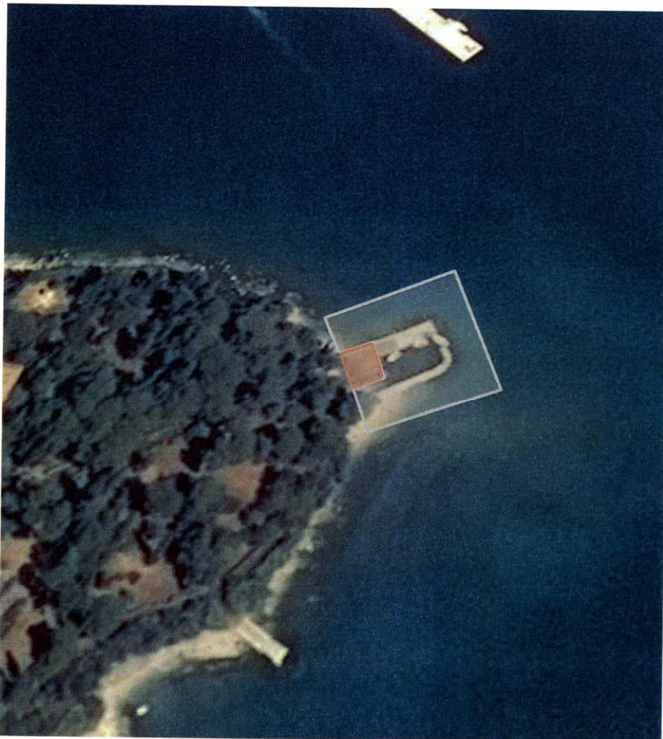
Otok Sveta Katarina - Istok