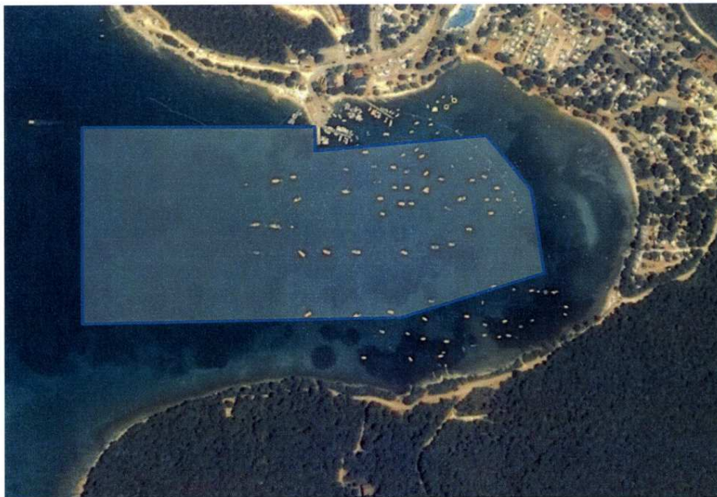
Sidište (nautički vez)